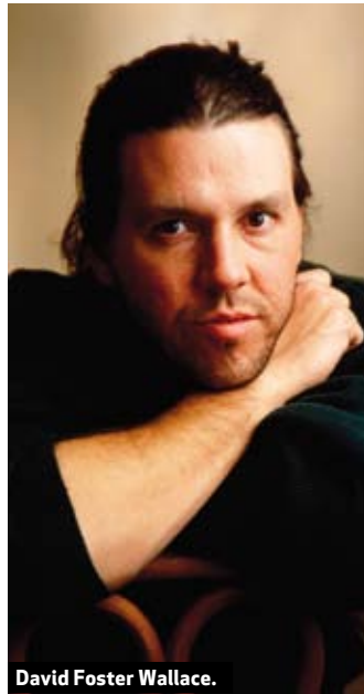
David Foster Wallace.

reciente la publicación de su primera novela, La escoba del sistema , y cuando DFW no era aún conocido por sus siglas ni por el suicidio que lo convertiría en mito. También merecen la pena las últimas que muestran