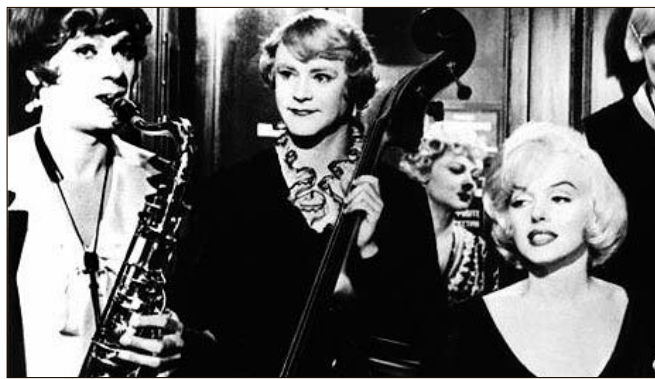
Imagen de 'Con faldas y a lo loco'.