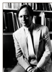
Tom Wolfe. ANAGRAMA

► Algo similar a lo que hizo el mismo autor con La hoguera de las vanidades , uno de sus mayores éxitos, trasladado al cine, en el caso de Nueva York, lo aplica ahora a la gran urbe de Florida, dejando constancia de ese hecho insólito que ha supuesto que los inmigrantes cubanos se conviertan en la comunidad dominante en una generación. Wolfe es también el patriarca del llamado "Nuevo Periodismo".