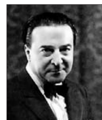
Julio Camba, REINO DE CORDELIA

► Como ocurre con otros escritores españoles del pasado, poco a poco vamos redescubriendo a Julio Camba (1884-1962), periodista, humorista y viajero, de cuyo fallecimiento se cumple ahora medio siglo. Ésta es una recopilación de sus artículos en el Londres de hace cien años, en la que encontramos ingeniosas observaciones sobre los ingleses y los españoles de la época.