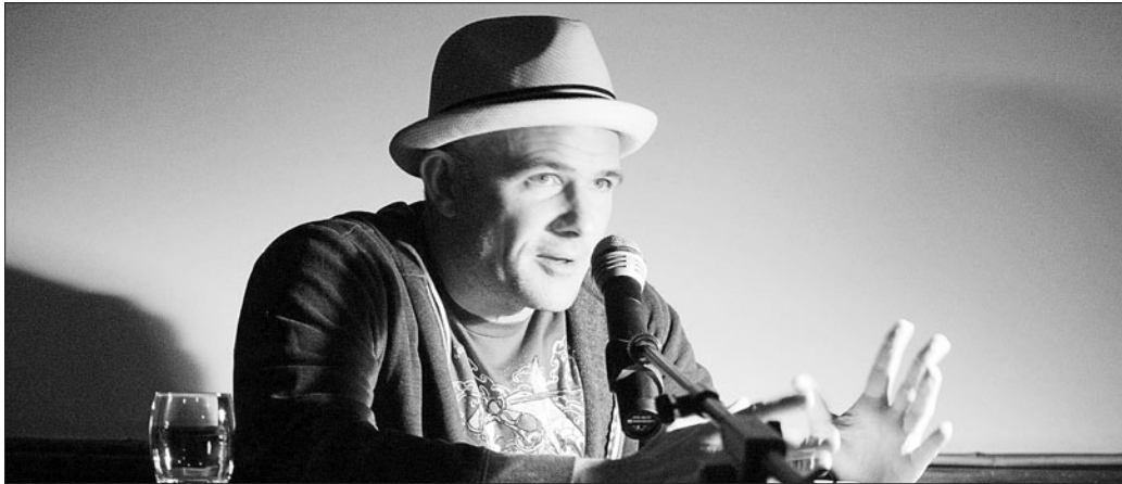
El escritor norteamericano Mark Z. Danielewski, al que algunos comparan con Borges y con el mismísimo Cervantes.