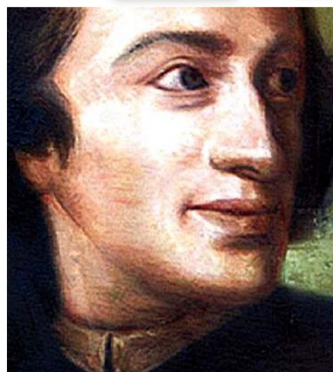
Giuseppe Tartini, un músico que pasó a la historia por la pieza El trino del Diablo