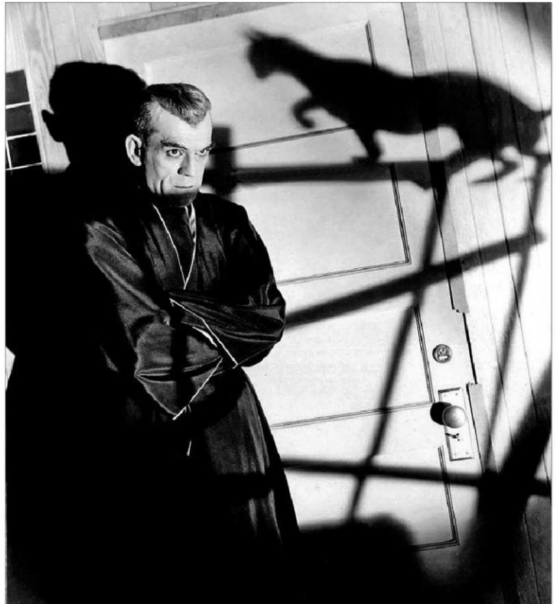
El actor Boris Karloff en una escena de 'Satanás', de Edgar G. Ulmer, que inspira la novela 'Parpadeo'.

Como en Zeroville (Ed. Pálido Fuego), hipnótica declaración de amor al celuloide a cargo de Steve Eriksson, que utilizaba personajes ficticios para reivindicar a cineastas radicales como John Milius, en Parpadeo desfilan los dobles de Pauline Kael, crítica cinematográfica de referencia en EEUU durante tres décadas, y Edgar G. Ulmer, director maldito donde los haya, conocido como «rey de la serie B» y autor de películas como Detour o Satanás . Lo que viene a reclamar Roszak, en una novela que comienza con el afán detectivesco del protagonista y va dejando paso a un terror